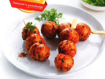
Minibrochette van kippenballetjes