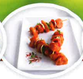
Kipfiletbrochette met paprika en ui