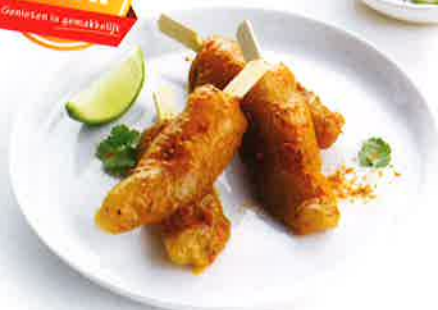
Brazade van kippenhaasje curry