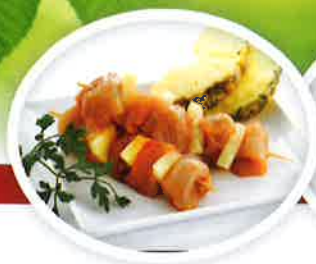
Kipfiletbrochette met ananas