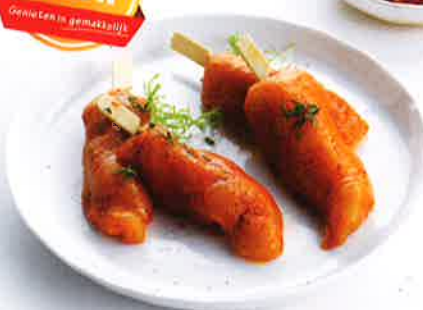
Brazade van kippenhaasje paprika